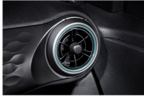
فتحات مكيف هواء فريدة من نوعها على شكل مروحة