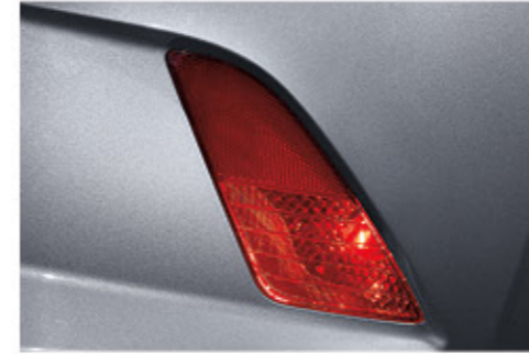
مصباح ضباب خلفية