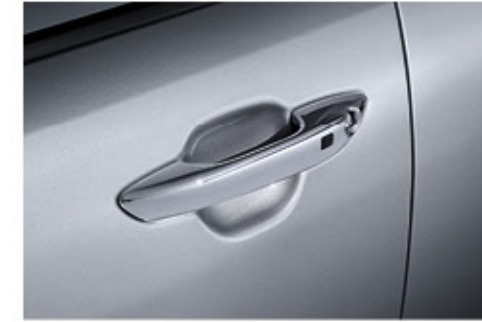
مقابض أبواب مطلية بالكروم