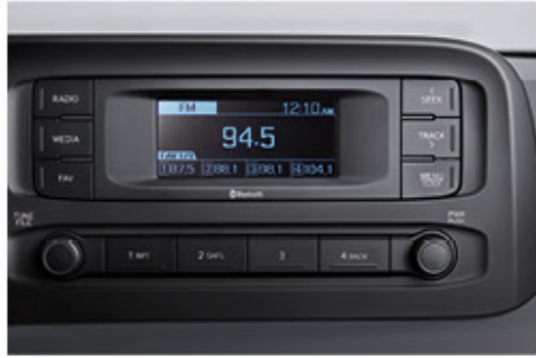
راديو + آر دي إس