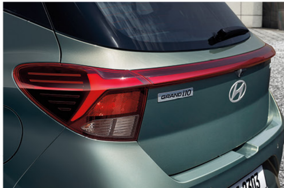
مصباح خلفية ليد

تجعلك سيارة جراند آي ١٠ تبدأ في مغامرتك القادمة على الطريق بأسلوب جريء ومثير. بها كل التفاصيل التي تعزز متعة القيادة. تتميز بجنوط ألومنيوم مقاس ١٥ بوصة ذات مظهر مثير، وشبكة مبرد سوداء لامعة أكثر جرأة تخطف الأنظار. وتضفي مصابيح ليد لمسمة من التطور التكنولوجي العالي بينما تخلق معالجة الطلاء ذات اللونين مظهرًا عصريًا مميزًا.