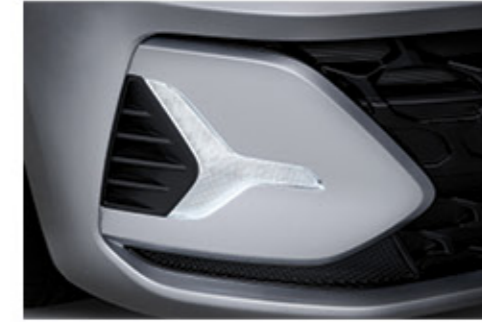
مصباح ليد للقيادة النهارية (دي آر إل)