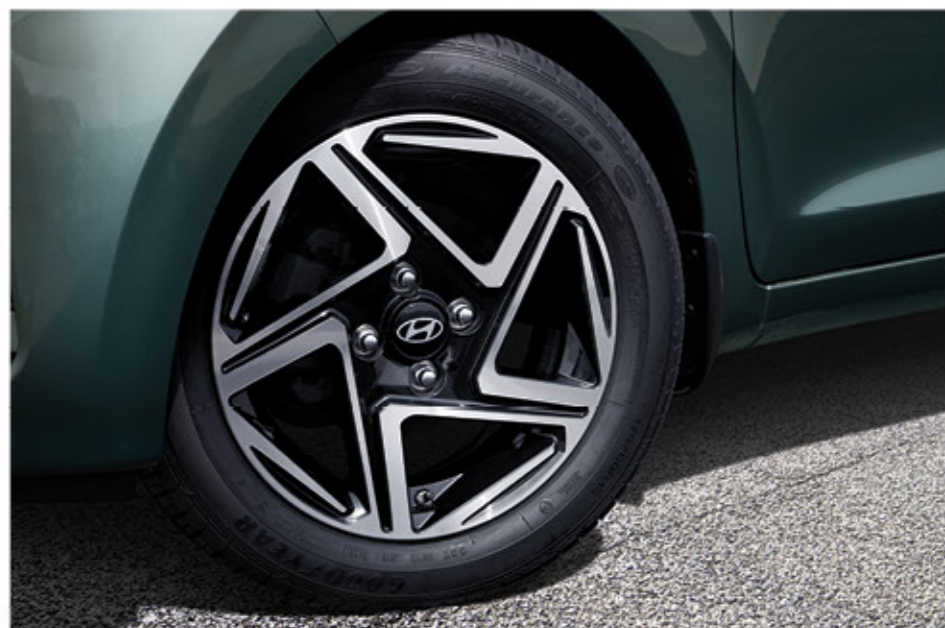
عجلات ألومنيوم مقاس 15 بوصة