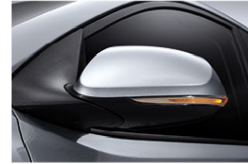
مرايا خارجية ومؤشرات اتجاهات