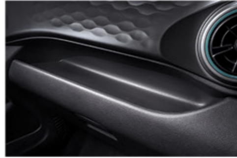
منطقة تخزين عملية