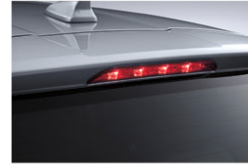
مصباح توقف ليد ذو إضاءة مرتفعة