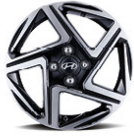
عجلات معدنية 15 بوصة