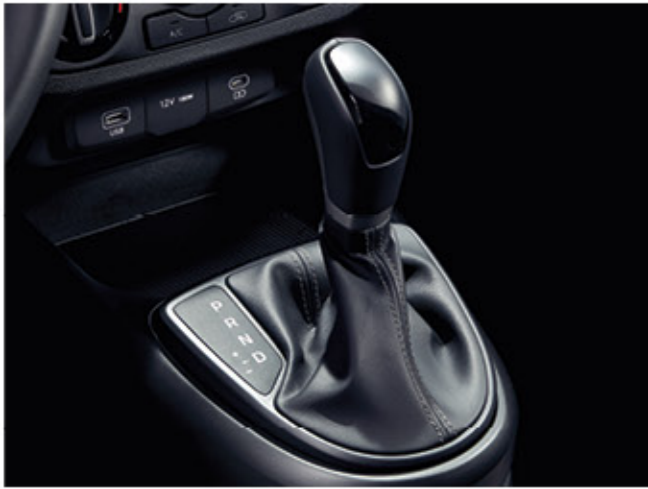
ناقل حركة أوتوماتيكي 4 سرعات

للسائقين الذين يطلبون أقصى قدر من الراحة ، تقدم هيونداي ناقل حركة أوتوماتيكي رباعي السرعات اختياري، موثوق به وهادئ وفعال.