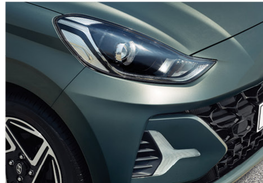
المصابيح الأمامية / مصابيح ليد للقيادة النهارية (دي آر إل)