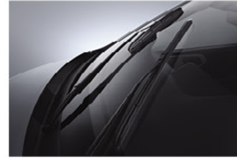
مشطحات زجاج نوعية Aero