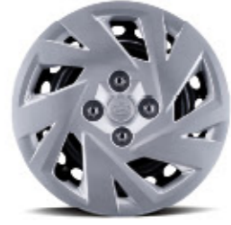
غطاء عجلة فولاذي مقاس 14 بوصة