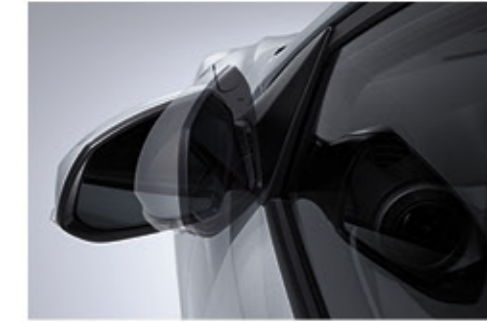
مرايا كهربائية قابلة للطي