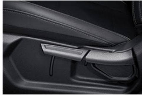
ضابط ارتفاع مقعد السائق