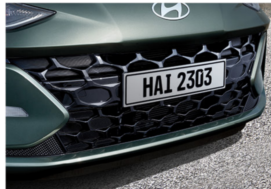
شبكة المبرد الأمامية باللون الأسود اللامع