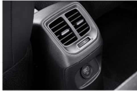
فتحات تكييف خلفية