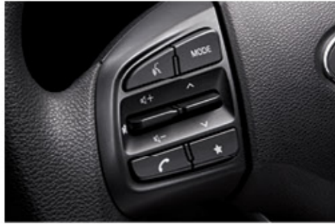
بلوتوث غير سلكي