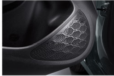
نظام مكبرات صوت أمامية / خلفية رباعي