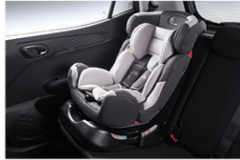
نظام مرساة الطفل